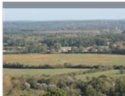
Randonnée - Circuit de la Tourbière et de Port Carrère, à Orist

Ancienne gravière d'extraction, le lac offre une eau de bonne qualité propice à la présence de nombreux poissons blancs, de black-bass et de sandres.