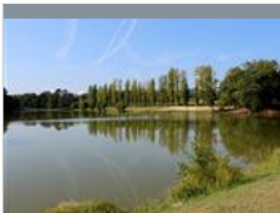
Lac de Luc