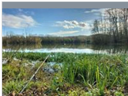
Lac de Saint Cricq du Gave

Lieu idéal pour les amateurs de détente au bord de l'eau. Sa promenade d'1,5 km environ, son restaurant traditionnel, ses postes de pêche, son aire de pique-nique, son arboretum et sa base d'activités de loisirs (jeux pour les enfants, mini-golf, etc), raviront petits et grands.